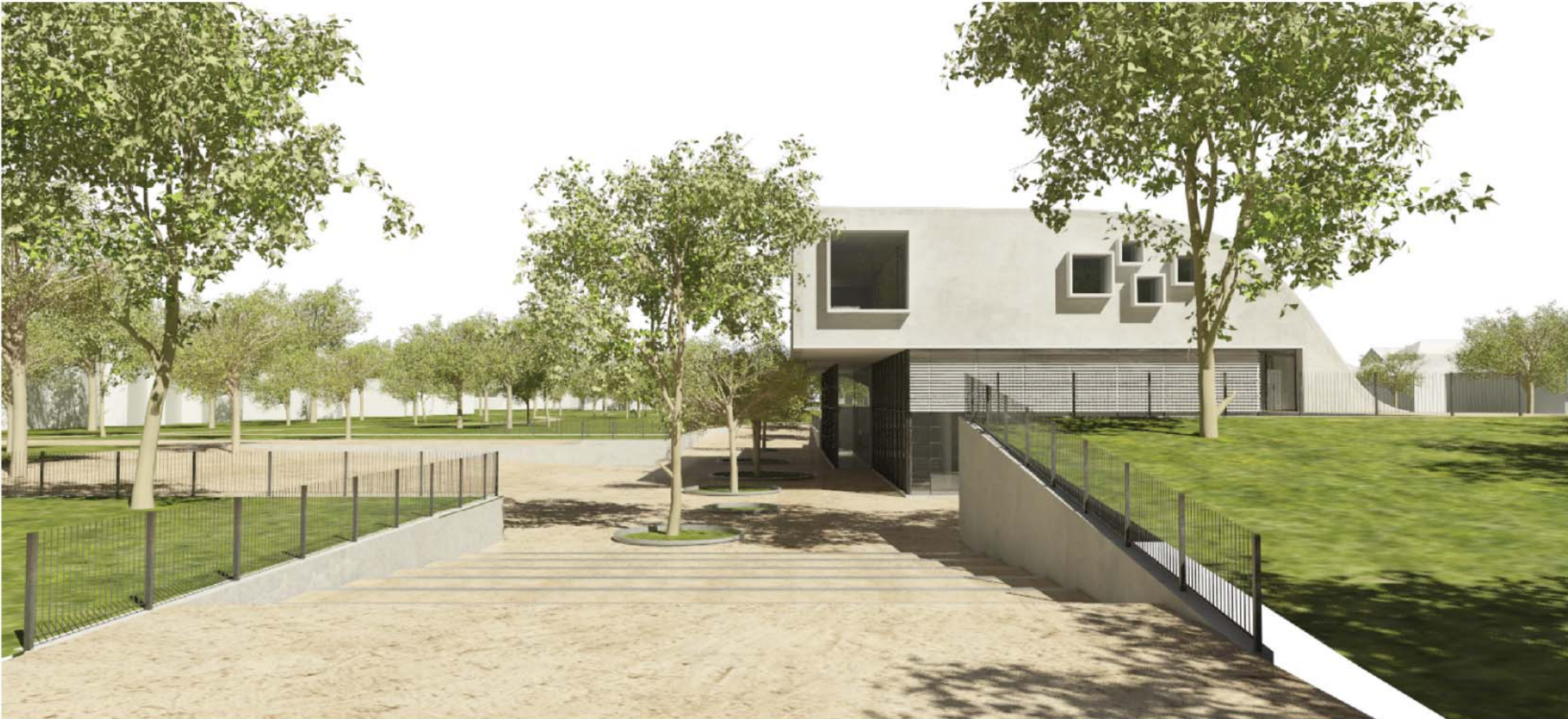
IPOTESI REALIZZAZIONE PER STRALCI